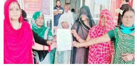
• गरुड़ एक्सप्रेस डेस्क

नीमच। जिला मुख्यालय से सटे ग्राम कनावटी में महिलाओं को झांसे में लेकर उनके साथ धोखाधड़ी करने का एक बड़ा मामला सामने आया है। समूह लोन खुलवाने की बात कहकर बारी-बारी से महिलाओं से रूपये ऐंटे गए, और वह अपने झांसे में लेने वाली यहीं महिला लाखों रूपये लेकर गांव छोड़ फरार हो गईं, अब यह पूरा मामला जिला कलेक्टर और पुलिस तक भी पहुंचा है।